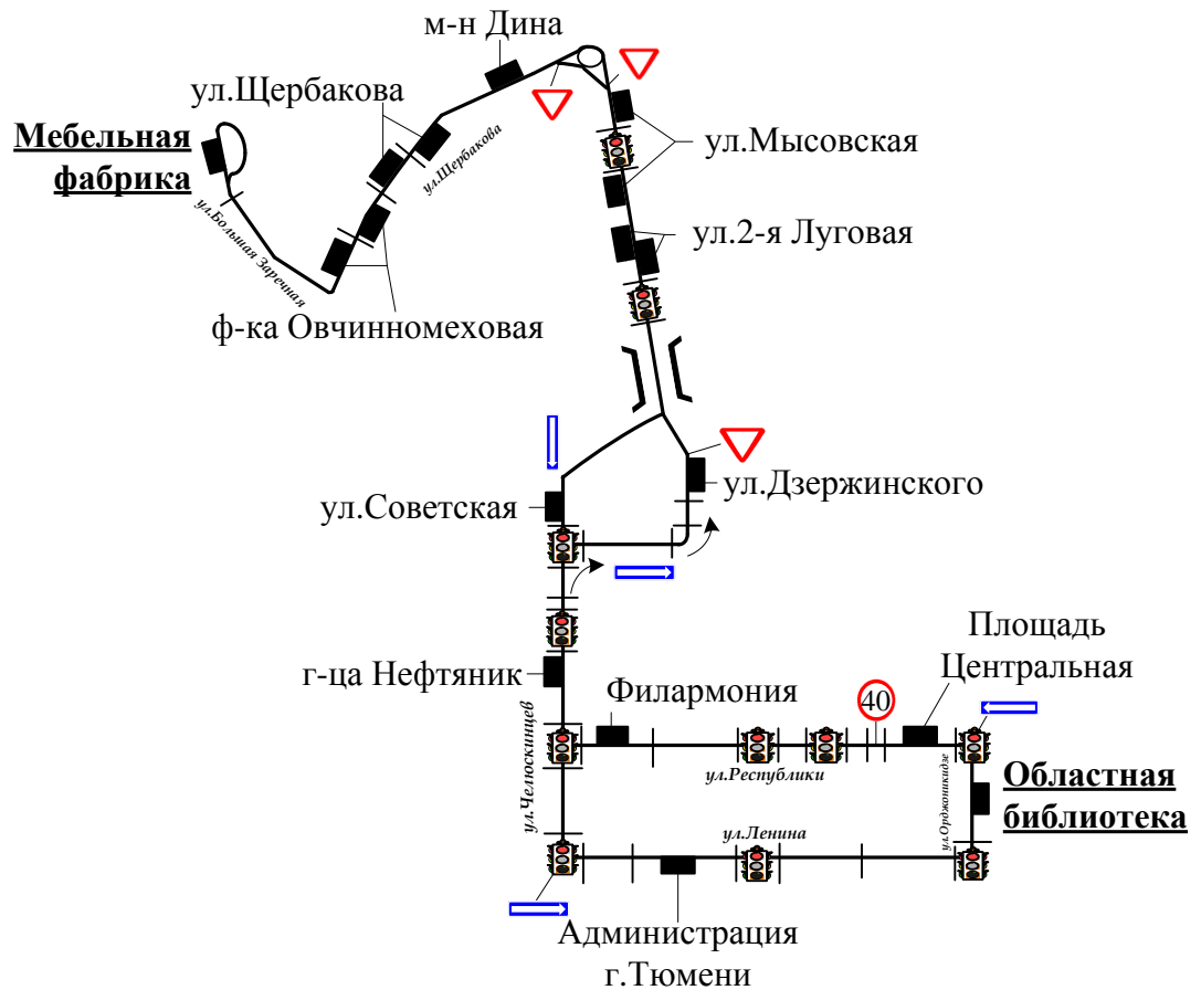
Схема маршрута № 26 «Областная библиотека - Мебельная фабрика» (ВРЕМЕННАЯ)